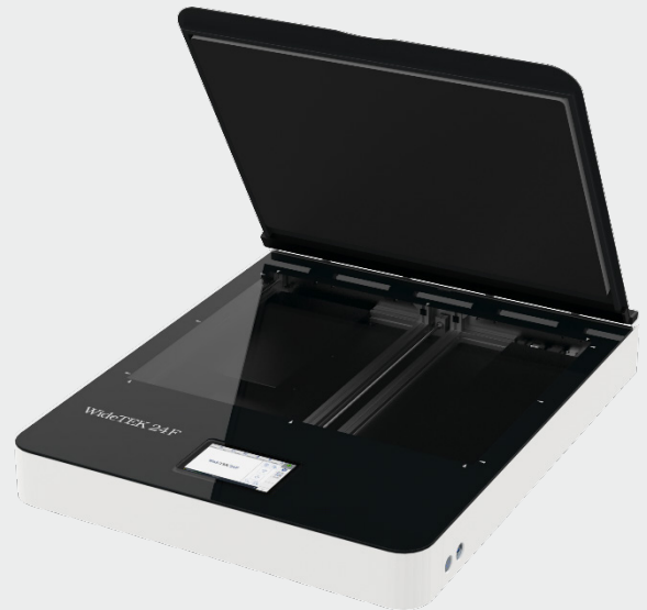
Стеклянная пластина с защитой от повреждений позволяет сканировать крупные оригиналы